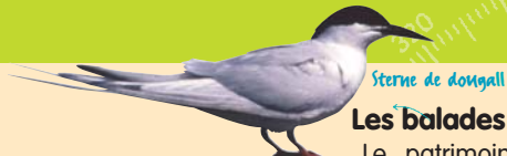
Sterne de dougall